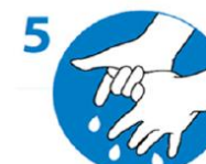
5 Daumen kreisend reiben