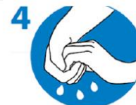
4 Finger verschränken und reiben