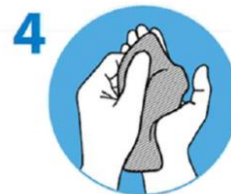
4 Mit sauberem Tuch abtrocknen