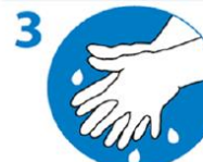
3 Handflächen mit gespreizten Fingern