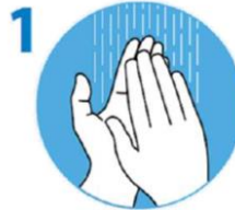
1 Fließendes Wasser