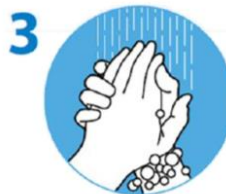
3 Gründlich abspülen