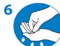
6 Fingerkuppen kreisend in Handflächen reiben