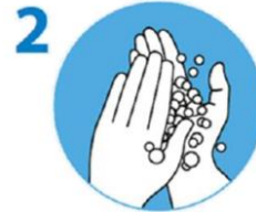
2 Mind. 20-30 Sek. Von allen Seiten einseifen